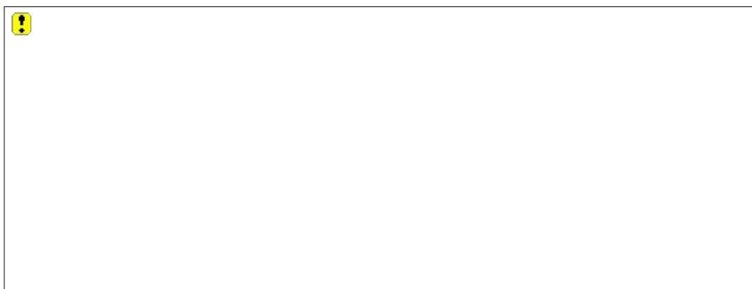
TABLA 1B. TRÁFICO DE INTERNET POR FUENTE

[11] TRÁFICO DATOS: TOTAL (GB): Corresponde al tráfico total de datos (Uplink + Downlink), medido en GigaBytes, que se cursó durante el mes del numeral [4] de la Tabla 1A del presente Formato, mediante las conexiones internacionales propias del PRST, hacia cualquier NAP ubicado en Colombia, a través de acuerdos de tránsito o peering, con destino a servidores de contenidos y aplicaciones, y en general a cualquier destino.