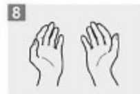
8 Una vez secas, sus manos son seguras.