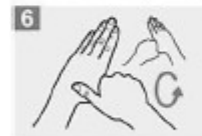
6 Frótese con un movimiento de rotación el pulgar izquierdo, atrápiendolo con la palma de la mano derecha y viceversa;