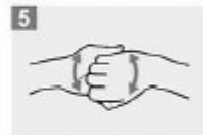
5 Frótese el dorso de los dedos de una mano con la palma de la mano opuesta, agarrándose los dedos;