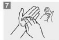
7 Frótese la punta de los dedos de la mano derecha contra la palma de la mano izquierda, haciendo un movimiento de rotación y viceversa;