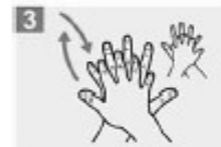
3 Frótese la palma de la mano derecha contra el dorso de la mano izquierda entrelazando los dedos y viceversa;