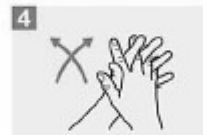
4 Frótese las palmas de las manos entre sí, con los dedos entrelazados;