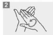
2 Frótese las palmas de las manos entre sí;