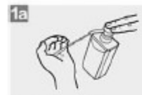
1a Deposite en la palma de la mano una dosis de producto suficiente para cubrir todas las superficies;

1 Duración de todo el procedimiento: 20-30 segundos